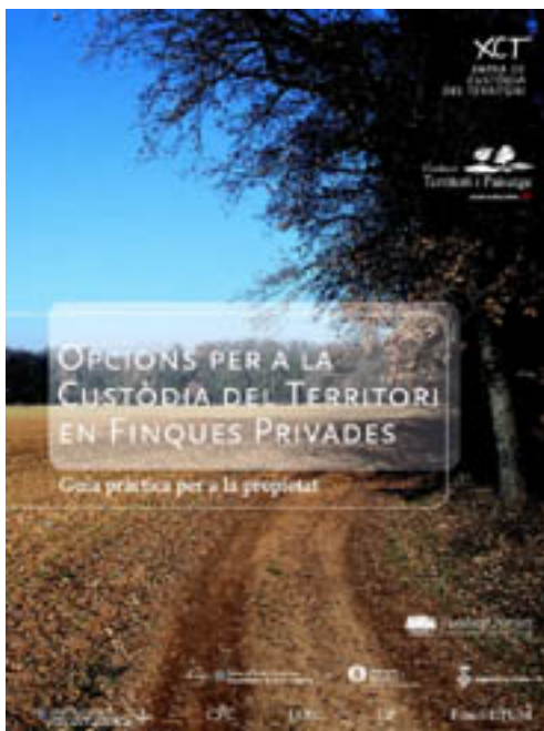
Figura 7. Portada de la guia d'opcions de custòdia per a finques privades.