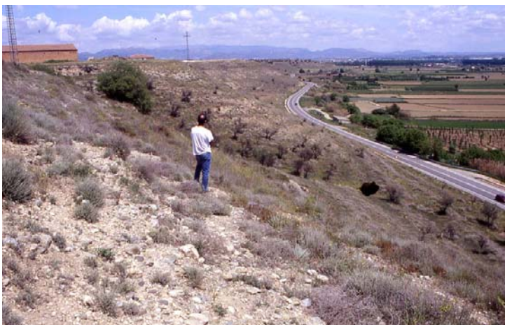
Figura 8. Ricard Blanch, de La Bassa Roja, observant uns secans a Menàrguens (la Noguera) on l'entitat valora la possibilitat d'acceptar la cessió de la gestió.