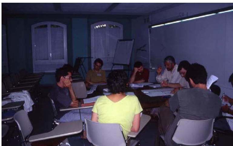
Figura 2. Grup de treball a la jornada de definició de Pla director de la XCT.