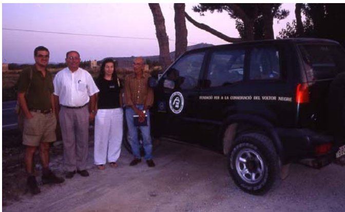
Figura 9. Membres de la Fundació per la Conservació del Voltor Negre i de l'Associació Balear d'Amics dels Parcs durant la visita de Juliol de 2002.