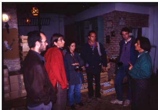
Figura 10. Visites a artesans i productors locals durant l'intercanvi WWF/ADPM a Mértola (Alentejo, Portugal). Fotos M.Sanjuán.