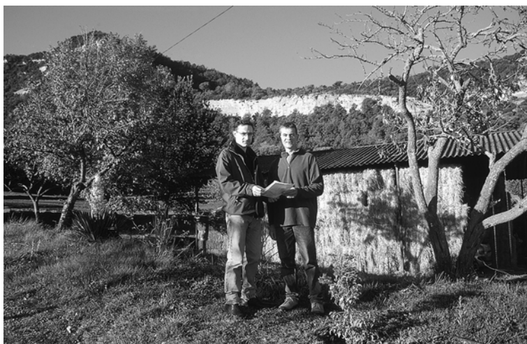
Figura 1. Propietaris i entitats de custòdia, persones clau per a la conservació del territori.

La custòdia del territori es refereix en un sentit ampli al " conjunt d'estratègies i tècniques diverses que pretenen afavorir la responsabilitat dels propietaris i els usuaris del territori en la conservació dels seus valors naturals, culturals i paisatgístics i en l'ús responsable dels seus recursos ".